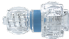
Tuohy-Borst Adapter adaptateur Tuohy-Borst Tuohy-Borst adapter