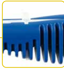
Arretierungsknopf Bouton de verrouillage Locking button