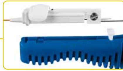
Herausnehmbares Bedienelement Élément de commande démontable Removable control element