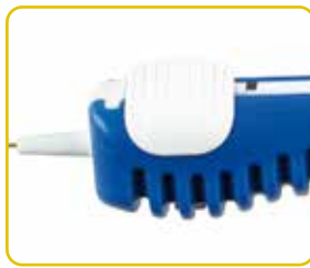
Schieber Poussoir Grafter